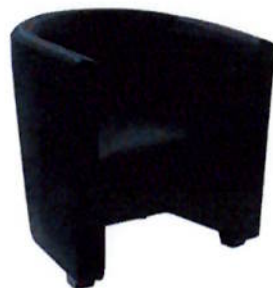
Poltrona tipo Jet meia lua na cor preta