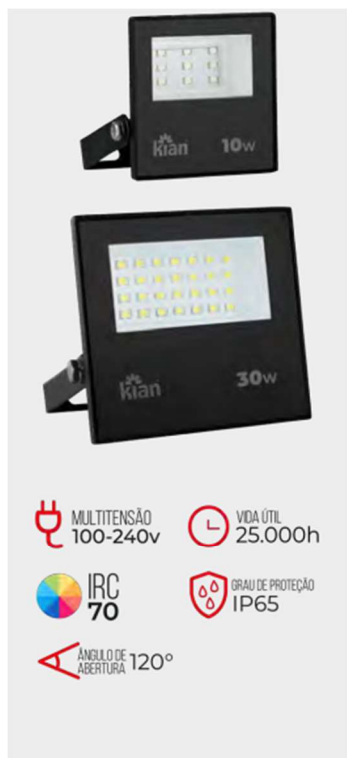
LUMINÁRIAS LED 36

file:///C:/Users/porto/Downloads/1748441899855CAT%25C3%2581LOGO%25202025%2520MOBILE%2520compactado%25202.pdf