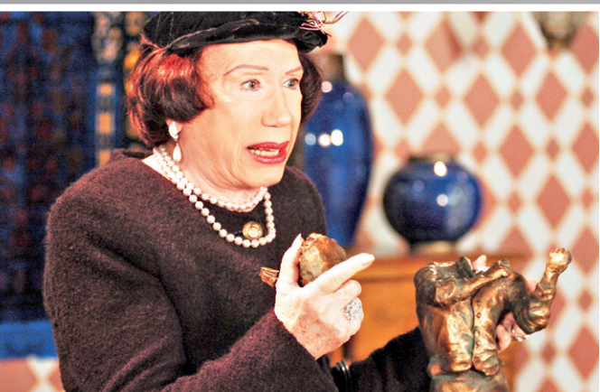
Berta Loran teve carreira marcante. No detalhe, a atriz em 'Escolinha do Professor Raimundo'

A estreia aconteceu cedo, aos 14 anos, e de forma bastante inusitada. "Eu sempre fui trapalhona, traquina, sapeca, danada. Com 14 anos, botei o salto alto da minha mãe e subi no palco. Quebrei o salto e saí mancando.