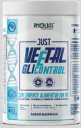
VEETAL GLICONTROL BAUNILHA 450G

O Veetal GliControl é ideal para dietas restritivas de sacarose, frutose e glicose. Rico em proteínas, auxilia no ganho de massa muscular, e suas fibras promovem o bom funcionamento intestinal. Contém ingredientes que reduzem o índice glicêmico, melhoram a tolerância à glicose e apresentam carboidratos de lenta absorção, contribuindo para o controle dos níveis de glicose no sangue. Também inclui antioxidantes que ajudam a prevenir danos oxidativos e complicações relacionadas à Diabetes Mellitus.