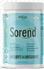
SOREND pote Sem Sabor 500G