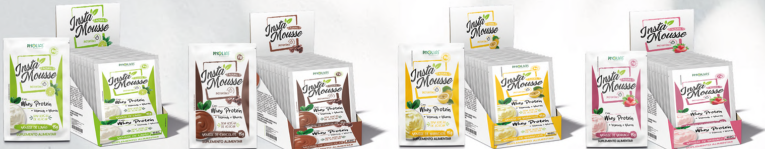
Mousse de Limão