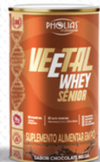
VEETAL WHEY SÊNIOR CHOCOLATE 450G