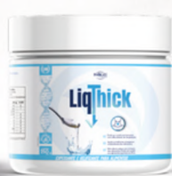
LiqThick SEM SABOR 250G

Sua fórmula inovadora evita o risco de aspiração, proporcionando uma alimentação tranquila. Além disso, mantém as propriedades nutricionais dos líquidos, assegurando que o paciente receba a hidratação e a nutrição necessárias.