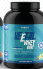
VEETAL WHEY BARI BAUNILHA 900G