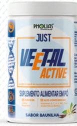
VEETAL ACTIVE BAUNILHA 450G

FONTE DE: Vitamina K, B6, B9, ferro, magnésio, manganês e colina