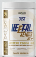
VEETAL SÊNIOR 50+ BAUNILHA 800G