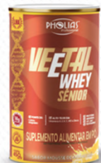
VEETAL WHEY SÊNIOR MARACUJÁ 450G