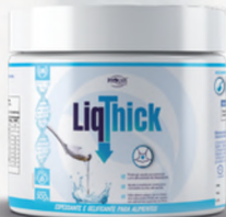
LiqThick SEM SABOR 300G