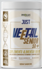
VEETAL SÊNIOR 50+ SEM SABOR 800G