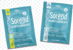
SOREND sachê BAUNILHA 30G