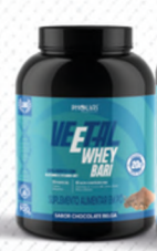
VEETAL WHEY BARI CHOCOLATE BELGA 900G