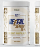
VEETAL SÊNIOR 50+ BAUNILHA 400G