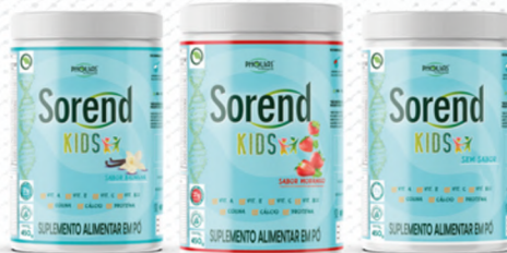
SOREND kids pote BAUNILHA 450G