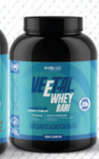
VEETAL WHEY BARI SEM SABOR 900G