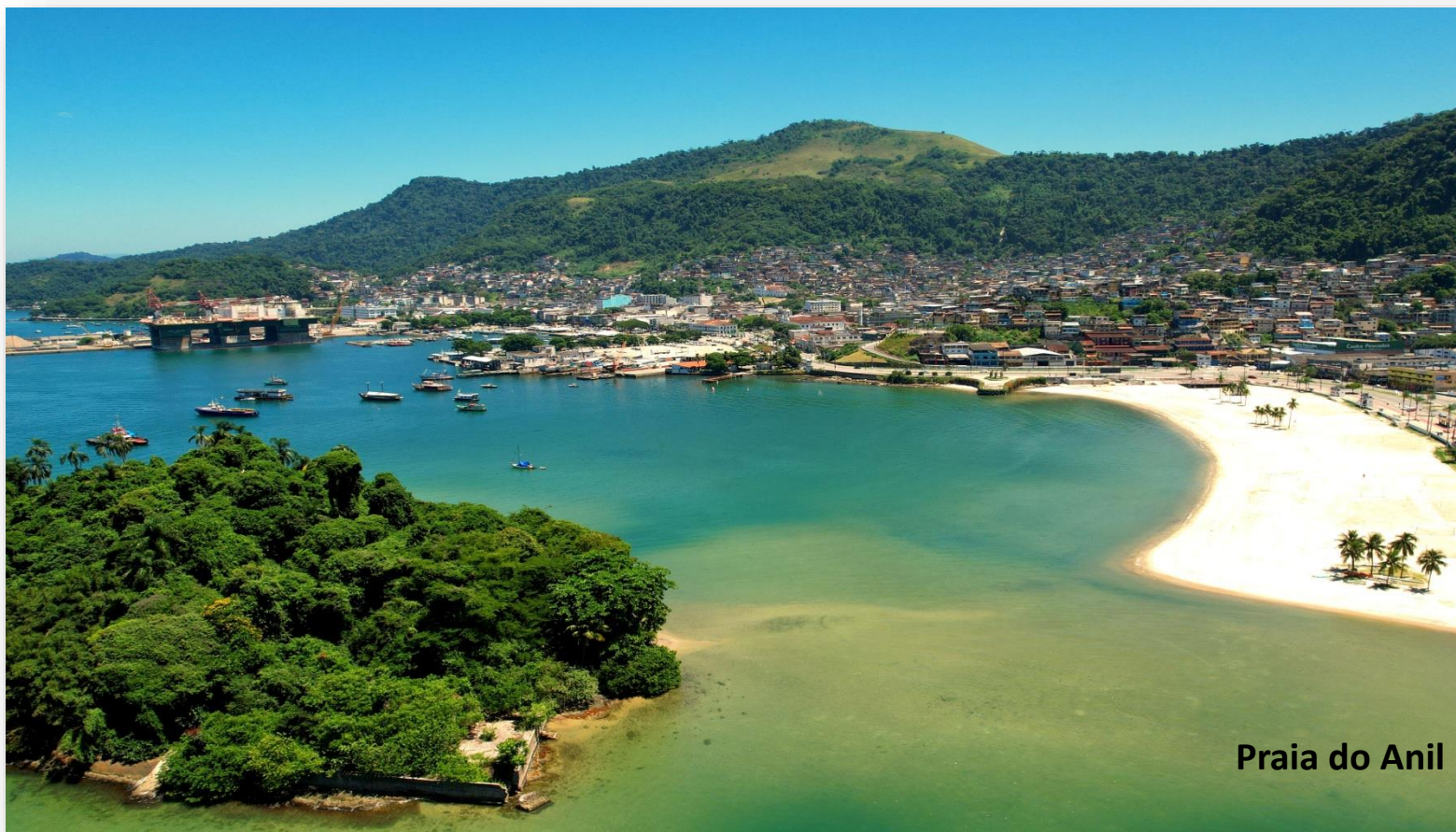
Praia do Anil

Este é o verdadeiro exercício de democracia e de cidadania